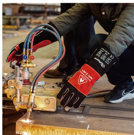
✓ Heavy Duty Quality